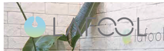
視認性を損なう背景への配置